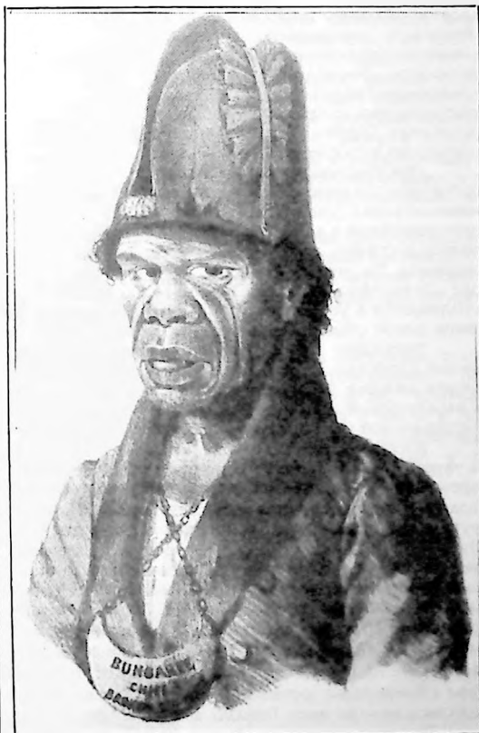
Чарльз Родюс. Король Бонгари. 1832. Национальная библиотека Австралии