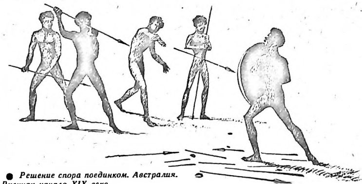
● Решение спора поединком. Австралия. Рисунок начала XIX века.

Часто причины военных столкновений коренились в сфере зачаточных религиозных представлений. Нам трудно понять психологию первобытного человека,