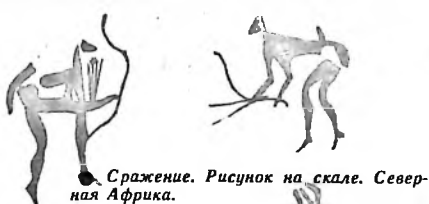
Сражение. Рисунок на скале. Северная Африка.